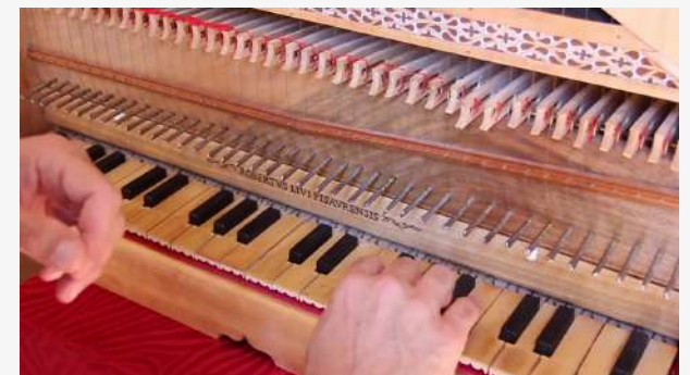
Non na al suo amante