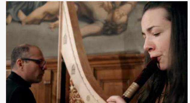
Che debbio fare