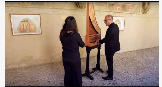
Elas mon cuer